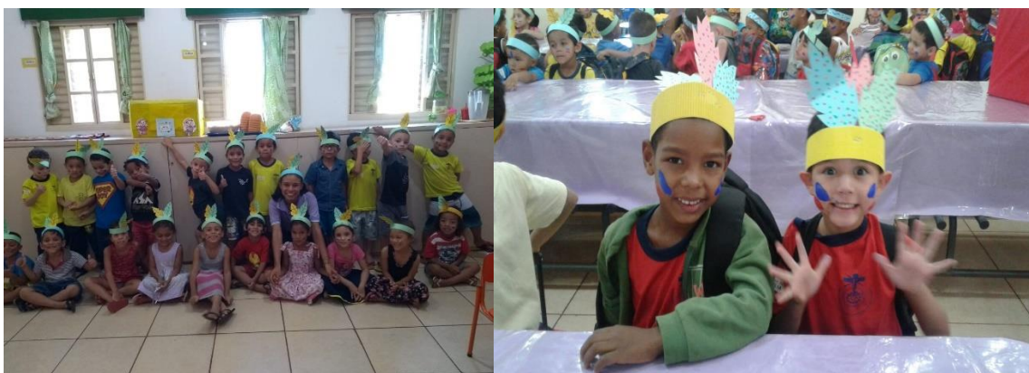
Atividades lúdicas na Creche São José Operário (imagem 1) e (imagem 2).