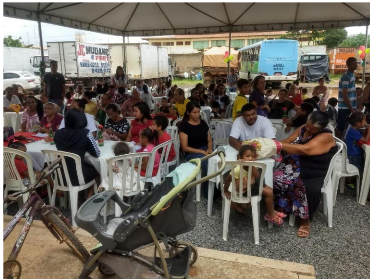
Imagem – A comunidade reunida nas dependências do Centro Catequético e na área com tendas montadas para acolher de 900 a 1.000 pessoas. Ao final do almoço, mais de 500 cestas básicas e 100 panetones distribuídos no dia 25 de dezembro de 2018.

c) Atendimento de Médicos voluntários: ortopedia, clínica, nutricionista, psicopedagogo, pediatria, odontologia, oftalmologia, no ano de 2018: