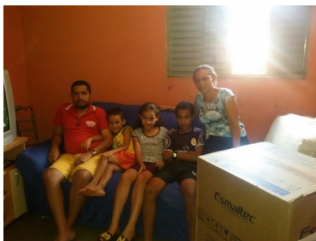
Imagens – Famílias acompanhadas pela assistente social da PRODEIN