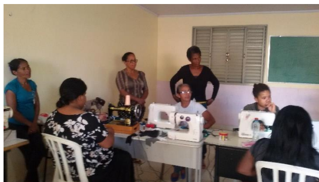
Imagens- Início das oficinas de corte costura na Instituição e parceria com o Rotary Club do Centro Oeste

Esse serviço foi implementado visando atender 120 mães dos alunos da Creche São José Operário e 50 adolescentes de 12 a 17 anos dos projetos da Instituição PRODEIN e seus familiares.