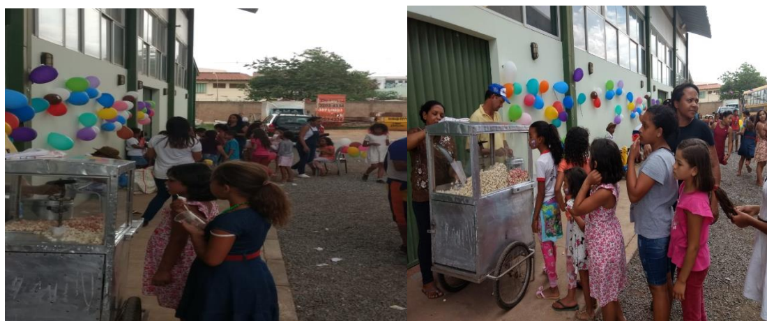
Imagens – Projeto Casulo do Saber