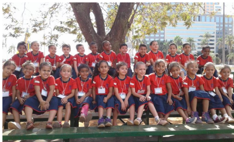
Alunos da Creche São José Operário: passeio da turma dos formandos 2018

Avaliação das ações desenvolvidas deu-se mensalmente sob o foco do planejamento estratégico, como consequência do norteamento de uma base conceitual dinâmica, proativa e integrada, com intuito de otimizar os resultados dos projetos em execução.