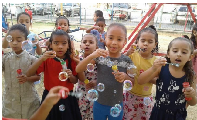
Alunos da Creche São José Operário: passeio da turma dos formandos 2018