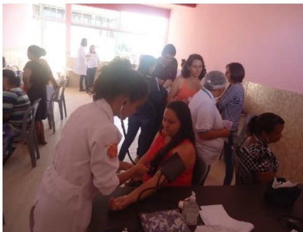
Imagem – Feira Médica com consultas, atendimento e encaminhamento para a rede pública ou para profissionais voluntários da PRODEIN que atendam gratuitamente.