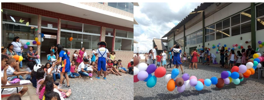
Imagens – Projeto Casulo do Saber no dia 12 /10/ 2018, dia das crianças.