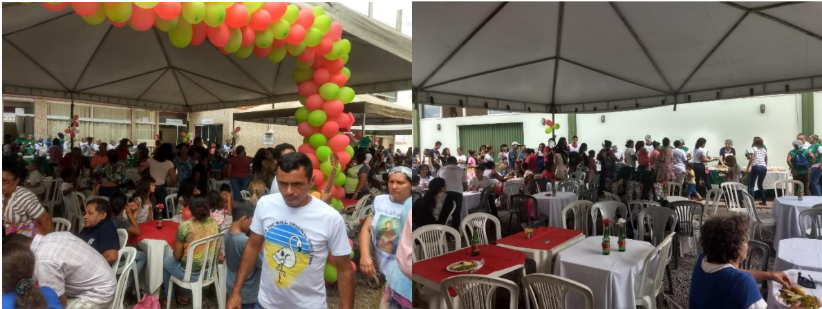
Evento realizado no dia 25/12/2018