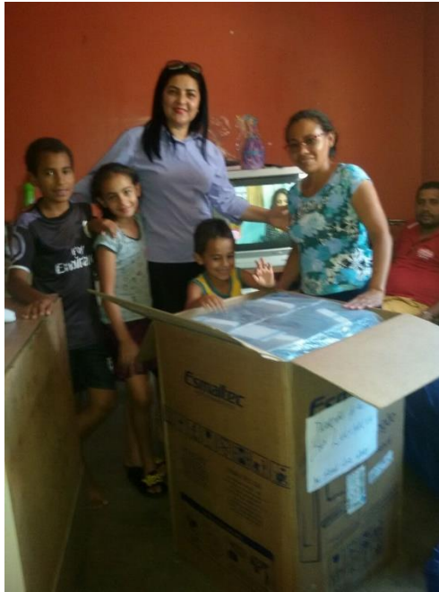
Imagens – Famílias acompanhadas pela assistente social da PRODEIN