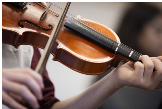
Projeto Escola de música